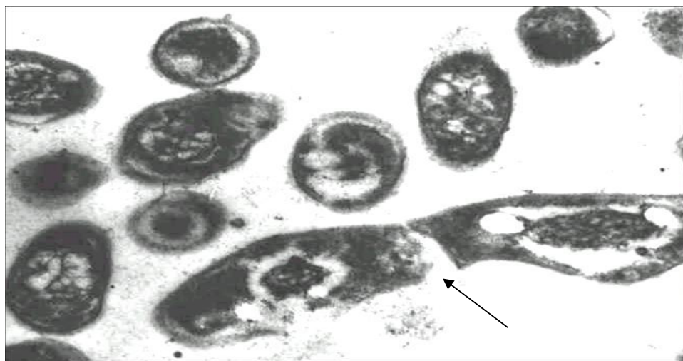
Рис.2. M.scrofulaceum з середовища Павловського, 10 діб культивування. Ізоморфний поділ. Збільшення 30000X2,4.

Друга група. Скотохромогенні МБ. При вирощуванні на світлі й у темряві мають темно-жовто-гаряче забарвлення ( M.gordonae , M.scrofulaceum ) (Рис.2).